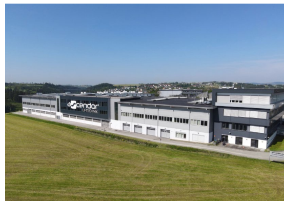
Bild 3/4: Der neue Produktionsstandort von Ascendor in Neufelden bietet eine um 42 Prozent auf 8.000 m 2 vergrößerte Produktionsfläche.